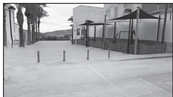
Barinas. Remodelación plaza y farola en la placeta