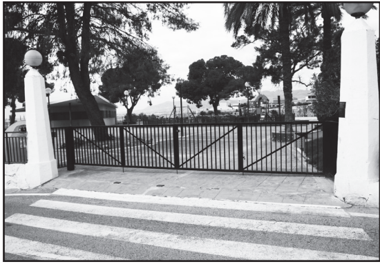
Instalación de puerta de seguridad en el Paseo de La Ermita